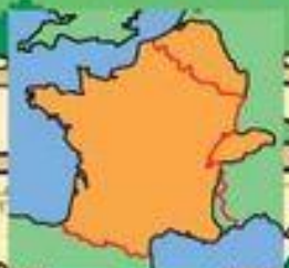
La Gaule romaine Frontières de la France actuelle