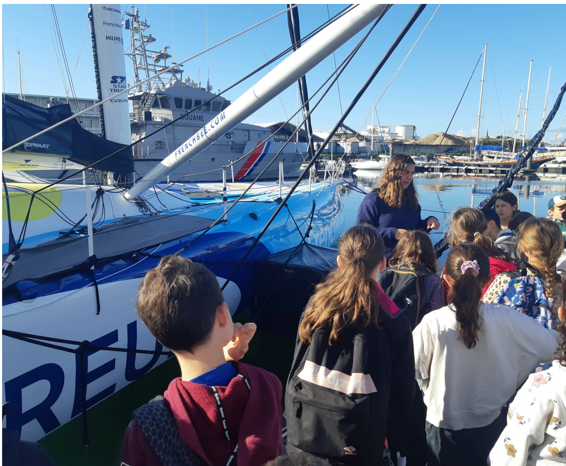
Les CM ont eu la chance d'observer de près l'IMOCA de Sébastien Simon.

Beaucoup ! François Gabart, Armel le Cléach et Jérémie Beyou ... D'autres grands sportifs également Roger Féderer ou Lewis Hamilton.