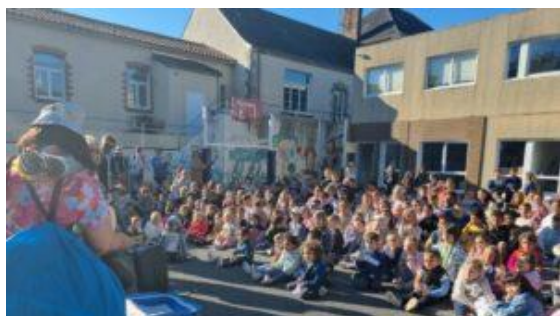
Lancement du projet d'année « Embarquement immédiat »

N'hésitez pas à consulter le site internet de l'école pour retrouver la vidéo dédiée à cette journée : http://mouilleronlecaptif-sjb.fr/